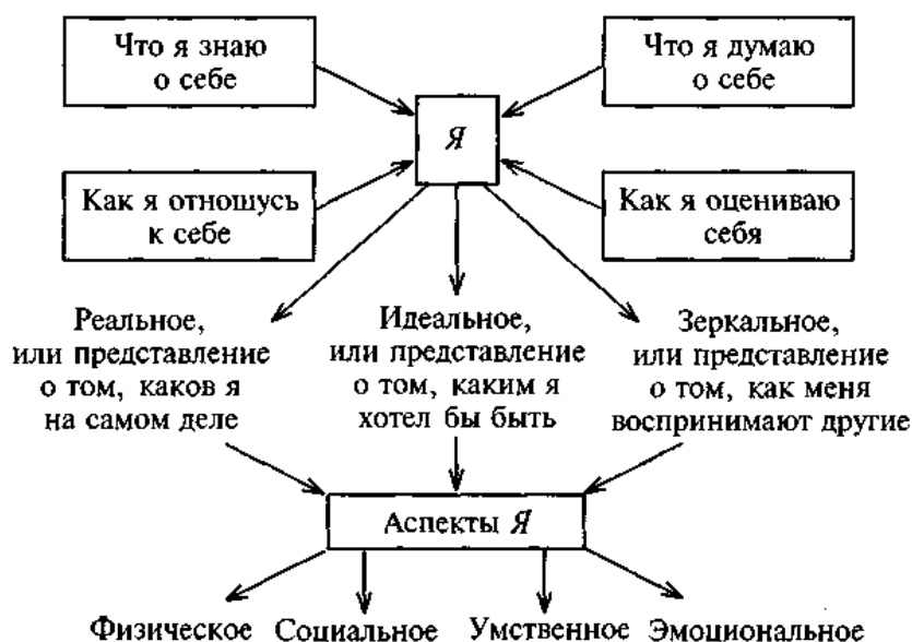
Рис. 2. Структура Я-концепции

ее характерные особенности. Схематически структуру Я-концепции можно изобразить следующим образом (рис. 2):